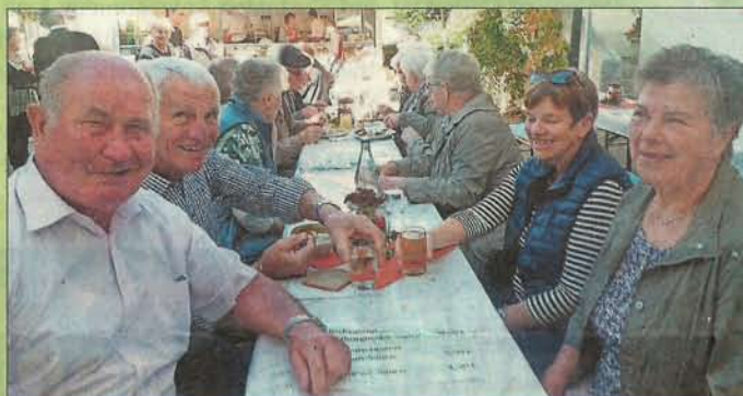
Gute Stimmung bei herrlichem Wetter – so war das Herbstfest rund ums Merdinger Weinhaus im vergangenen Jahr.

Weitere Informationen zu den Angeboten der WG Merdingen gibt es im Internet unter www.winzer-merdingen.de .